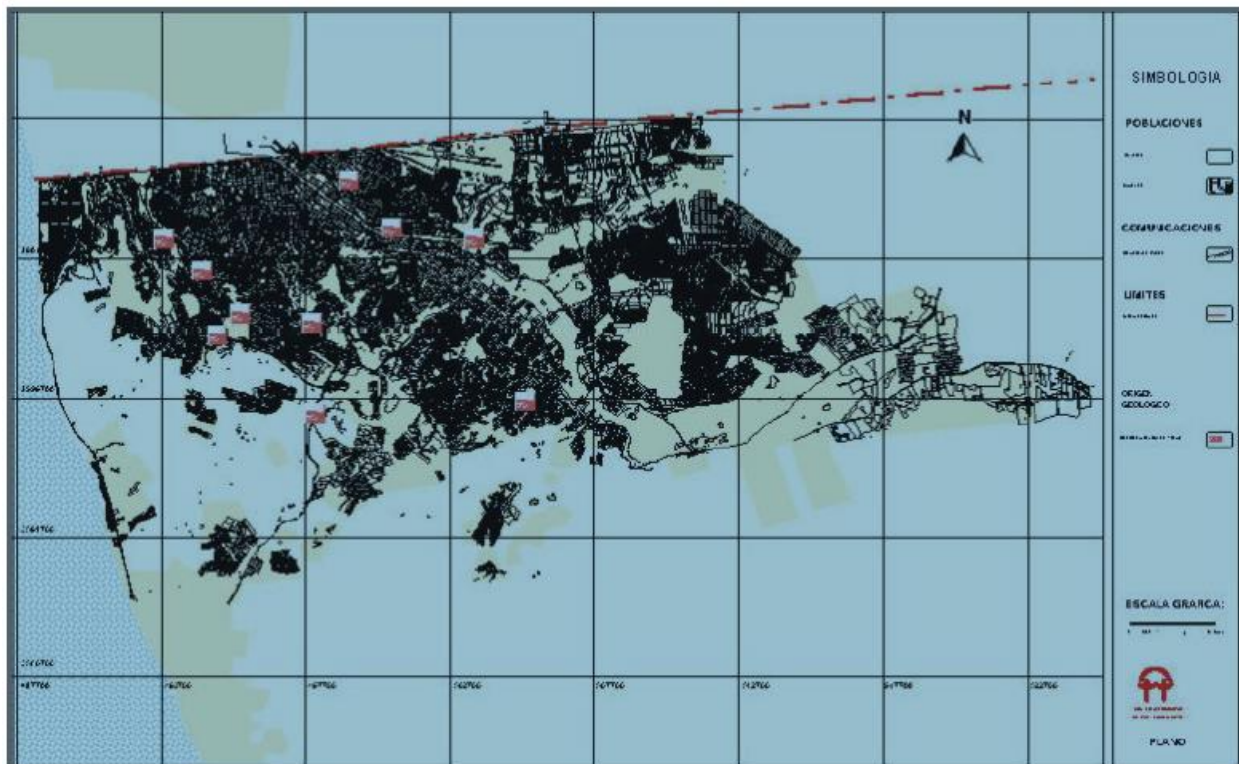
Ejemplo de los mapas utilizados en el atlas de riesgos, desarrollado con sistema de información geográfica.

Con base a lo anterior, al elaborar un mapa de riesgos se pueden representar estos en un documento fundamentalmente visual, que permite localizar, ubicar y medir las zonas de mayor vulnerabilidad, así como los agentes que afectan al municipio.